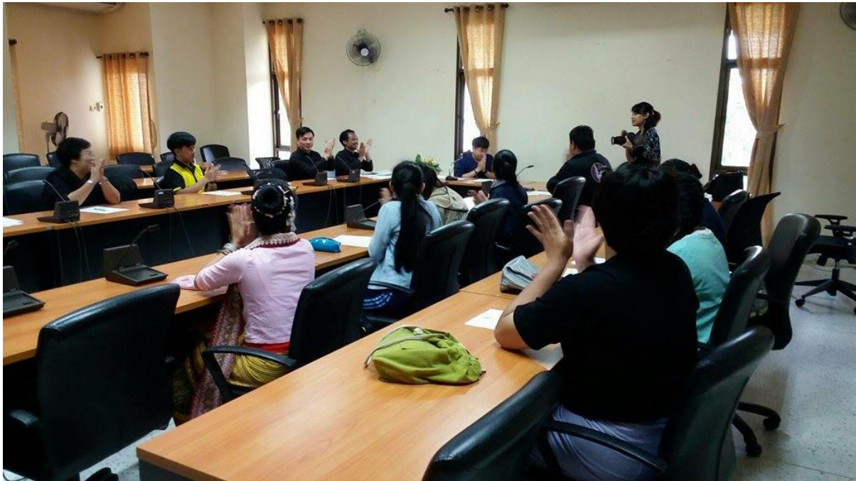
รายงานผลโครงการสร้างเครือข่ายการเรียนรู้เพชรราชภัฏ – เพชรล้านนา “การสร้างองค์ความรู้เกี่ยวกับการขับซอ” สำนักศิลปะและวัฒนธรรม