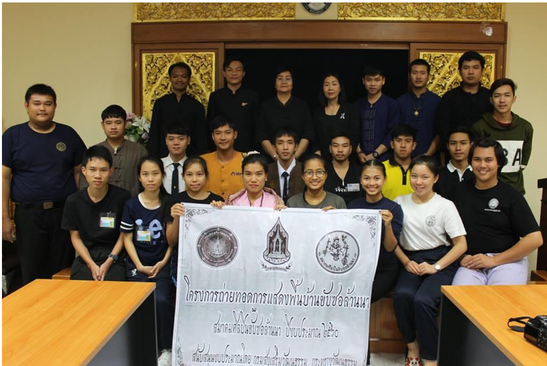
รายงานผลโครงการสร้างเครือข่ายการเรียนรู้เพชรราชภัฏ – เพชรล้านนา “การสร้างองค์ความรู้เกี่ยวกับการขับข่อย” สำนักศิลปะและวัฒนธรรม